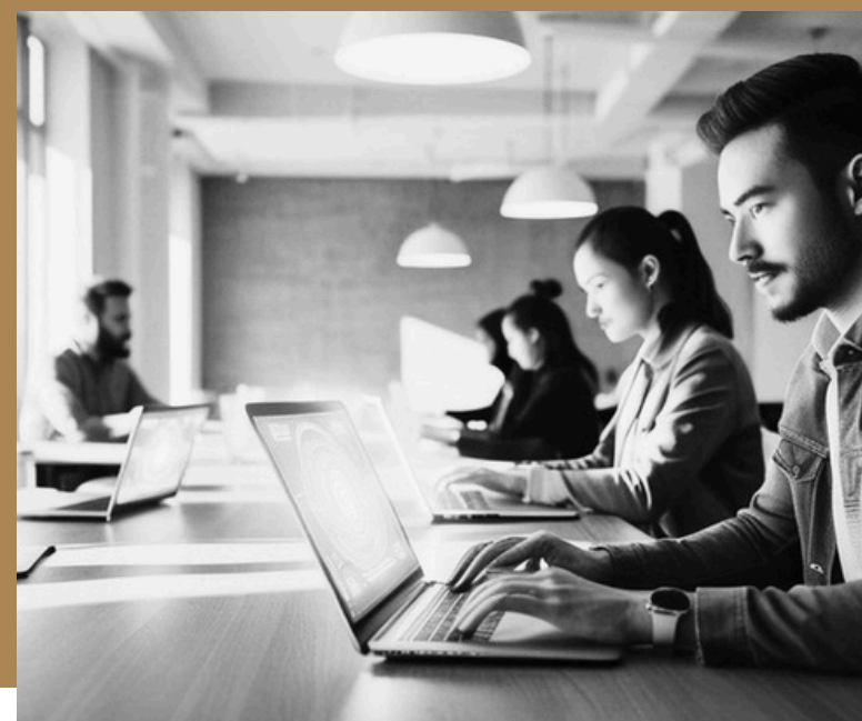
Mentalidade de longo prazo